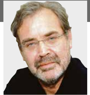
PIŠE Antun Masle