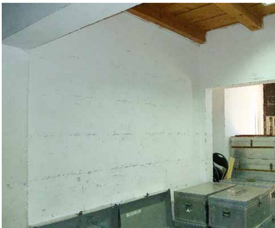
Zid iz kojeg su skriveni Meštrovićev reljef i gipsana skica