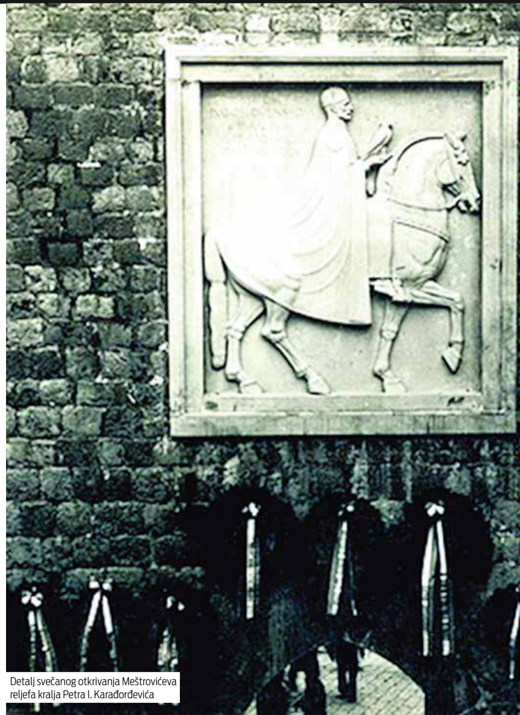
Detalj svečanog otkrivanja Meštrovićeva reljefa kralja Petra I. Karadorđevića

U nastalim poslijeratnim prekranjima državnih granica u Europi trajala je Država SHS još vrlo kratko – do 1. prosinca 1918. – kad je u Beogradu proglašeno »ujedinjenje samostalne Države Slovenaca, Hrvata i Srba u jedinstveno Kraljevstvo Srba, Hrvata i Slovenaca« (kasnije ustaljenog naziva Kraljevina SHS). Taj čin nije prihvatila Hrvatska vlada niti ga je potvrdio Hrvatski sabor. Formalni vladar nove države postao je srpski kralj Petar I. Karadorđević veličan laskavim