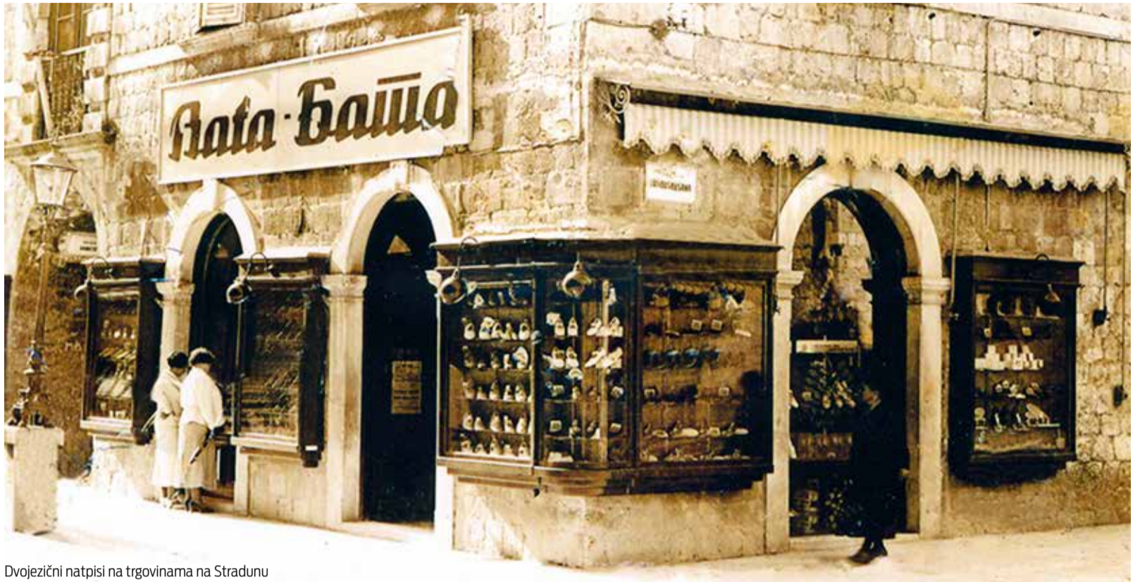
Dvojezični natpisi na trgovinama na Stradunu

Taj Meštrovićev izraz, kako pišu povjesničari, dovodi se u izravnu vezu s činjenicom da se on tijekom svog političkog djelovanja »u mnogo navrata deklarirao kao vatreni integralni jugoslavenski nacionalist«, uvjeren da je »Jugoslavija najbolji državno-pravni okvir za južnoslavenske narode, koji su zbog povijesnih okolnosti razdvojeni ali su u svojem najdubljem etničkom supstratu jedan narod«. To svoje uvjerenje Meštrović je dugo zastupao, premda se – kako piše u svojoj knjizi - u mnogobrojnim kontaktima sa srpskim državnici-ma, političarima i drugim istaknutim osobama imao priliku uvjeriti da oni jugoslovenstvo tumače u smislu ekspanzionističkih velikosrpskih pretenzija. Potpuno „otrežnjenje“ od unitarističkog jugoslovenstva uslijedilo je kod Meštrovića kad je njegov dugogodišnji poznanik kralj Aleksandar Karađorđević 6. siječnja 1929. ukinuo Ustav, raspustio Narodnu skupštinu i uveo samovlašće poznato kao šestosiječanjska monarhistička velikosrpska diktatura.