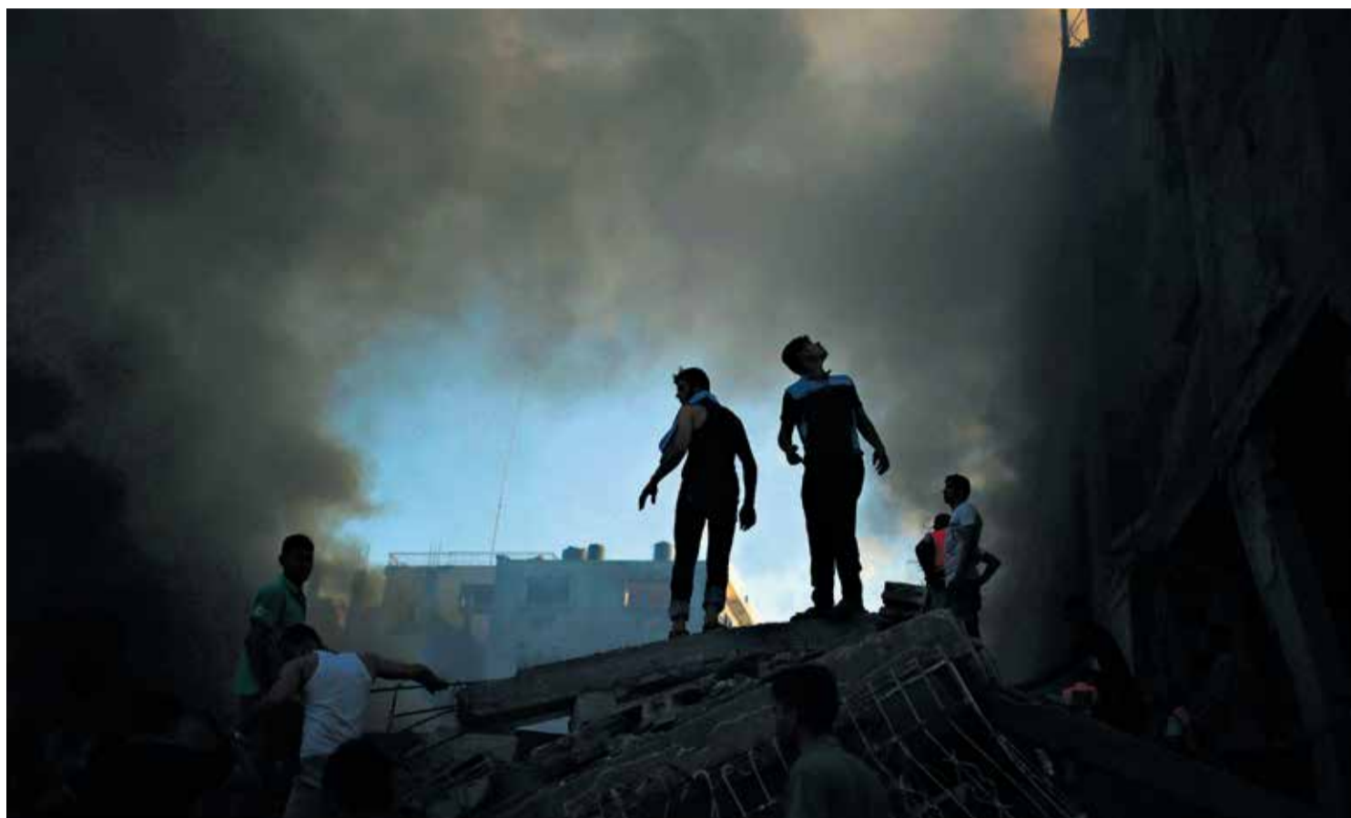
Palestinere prøver å slukke en brann etter et israelsk granatnedslag på Gaza.

I Pakistans grenseområder mot Afghanistan, i Nord Waziristan, har en million mennesker blitt internt fordrevne i de siste må-